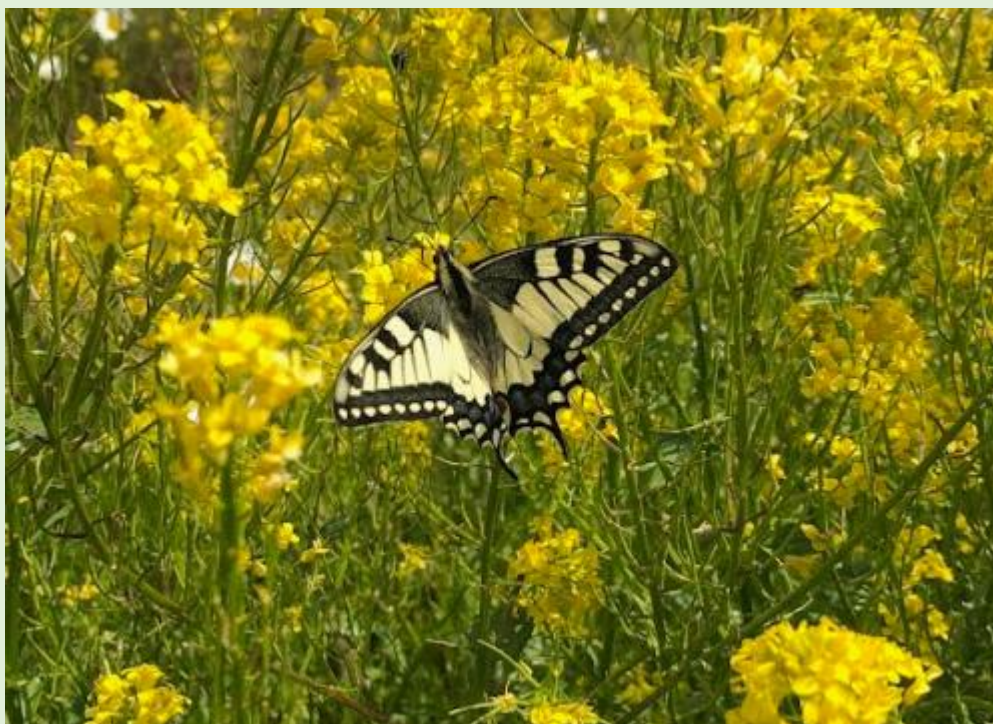
Koninginnepage op bezoek bij de poel